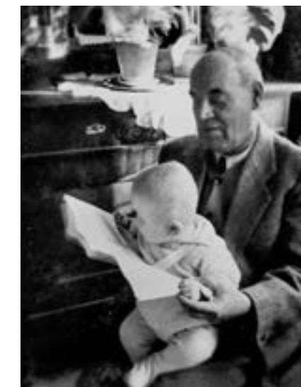
Nagyapám ölében ülök „könyvet olvasunk” a Major utcai lakásban

hallottam, hogy ha mínusz 50 fokban vizek valaki, a „termék” már megfagyva érkezik a földre. Gyerekként nem hittem... Kicsi voltam még, másról mesélt-e, nem emlékszem. Csak a savanyúcukorra a zsebemben.