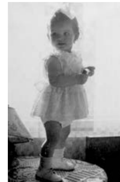
▲ Brigádkirándulás, balra apu, mögötte a cingár Gyuszika focizik, 1961 ▶ Márti a modell, 1960

Ja igen, a gyárban „írattuk” a szemetet is, amíg be nem vezették a gázt a bérházunkba. Minden nyár végén meghozták Lyukóból az általában kiváló minőségű, majdnem feketeszenet. Az első egy-két évben szamaras kocsi jött, akkor ültem először, ha nem is ló, de csacsi hátton.