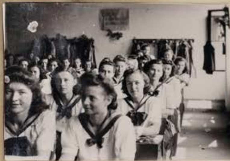
• Anyu osztálya évfutógi előtt, 1949. május Lányok, akik túlélték egy háborút és tele vannak a fiatalág tisztaságával, remé- nyével. Még nem tudták, hogy csak most jön a Rákosi rendszer, aztán meg 1956.