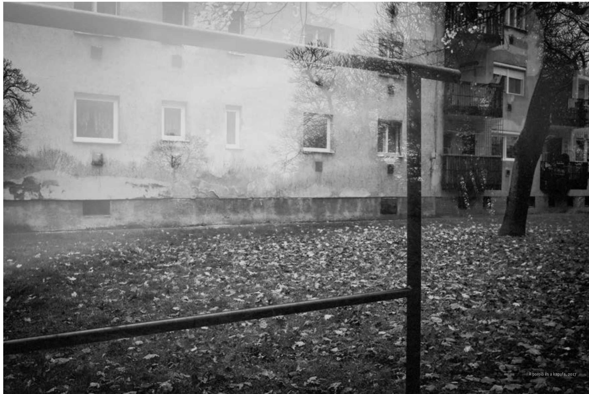
A poroló és a kapufa, 2017

Kissrác koromban nem volt gombfocis barátom, így én játszottam saját magam ellen! Azaz mindkét csapattal. Megcsináltam az egész NB1-et, egy-egy csapat azonos fajta gombokból állt. Vadásztam minden nagyméretű kabátgombra, kellett középhátvédnek.