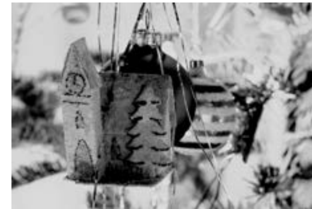
Réges-régi karácsonyi díszünk, egy téli templom

és a csirke bontása következett. Amikor már nagyobb voltam, előfordult, hogy segítettem anyunak: én fogtam a csirke lábát. Éreztem, ahogy remeg szegény, amikor kifolyik a vére. Utána hagymás zsíron megsütöttük ezt is. Akkor nem volt még vezetékes meleg víz a Glószban a bérházi lakásokban, ezért nagyobb lábásban, kaszrojban vizet melegítettünk a konyhai tűzhelyen. A csirke kopózása (de a mosogatás is) egy vájlingban, forró vízben/vízzel történt. Aki már csinált ilyet, az tudja, hogy ennek jellegzetes illata van. Rég láttam ilyet közlőrl, mégis jól emlékszem rá.