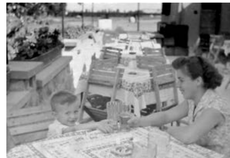
Tokajban anyuval, 1957. augusztus 11.

Apu egyáltalán nem ivott, életében talán egy-két alkalommal jött haza „borszagúan” és ilyenkor nagyon mosolygott.