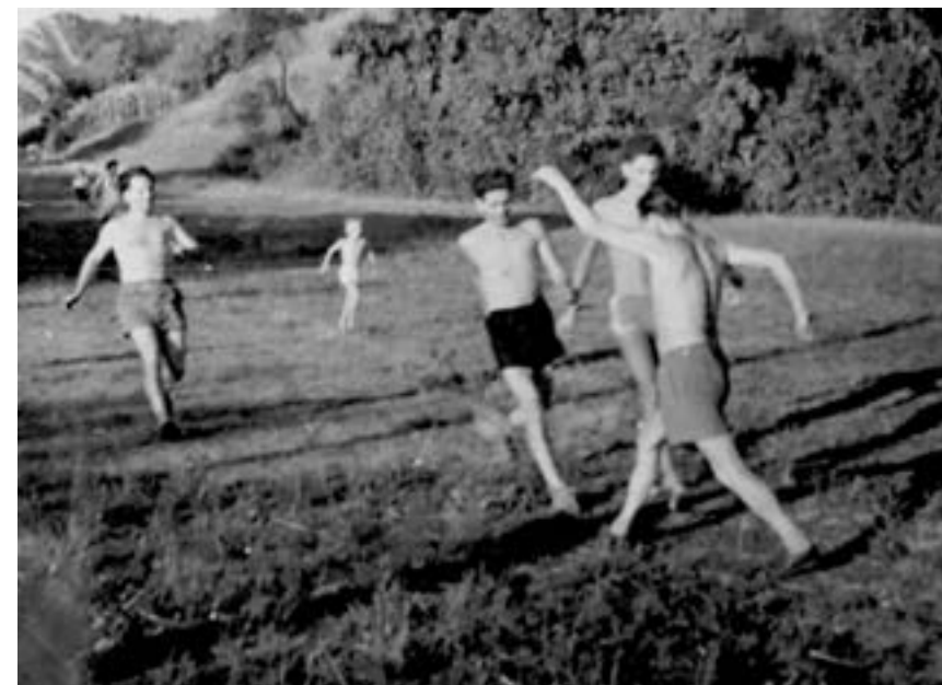
◀ A bátrak sportja, 1957 ◀ Lillafüreden anyuval, 1958