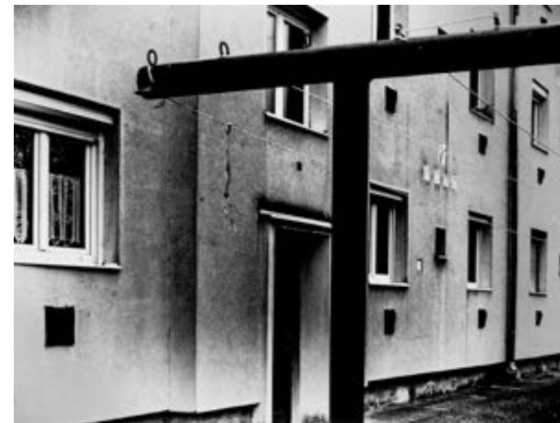
▲ Ruhaszárító oszlopok a Rácz Ádám utcai házak mögött, 2017 ◀ Hóban játszunk Mártival a ház előtt, háttérben a sarkon már a Csemege tábla ▼ Húgom és én az Örs utca 7. előtt. Szamaras kocsí hozta a szenet, mögötte a grund.