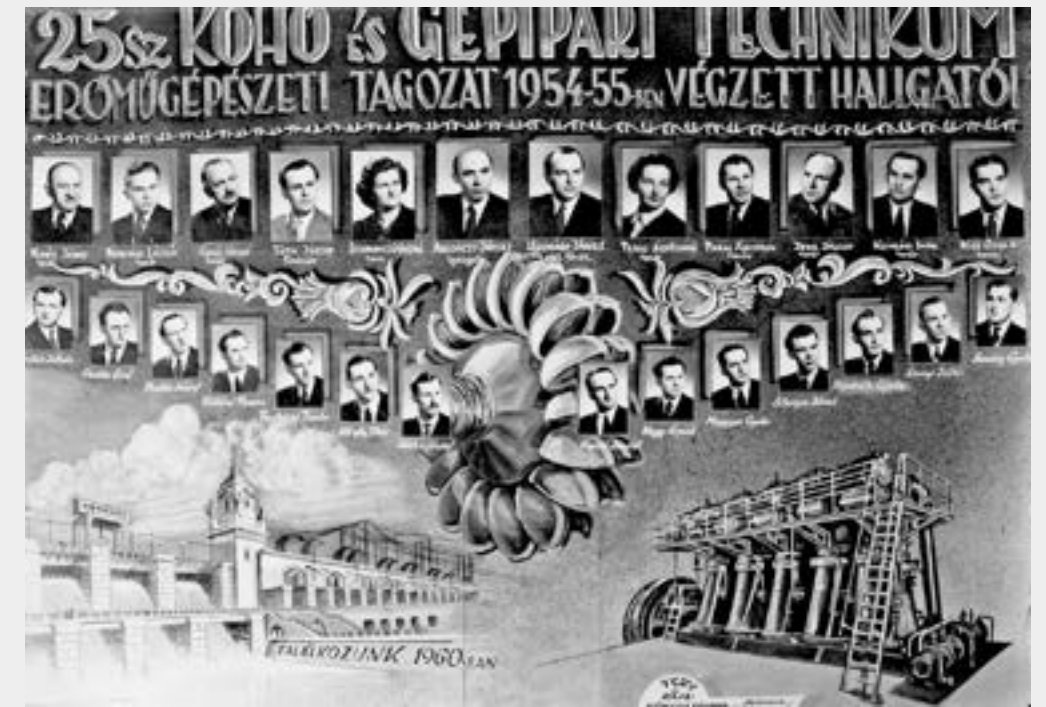
Tablókép a III-as szakközépben, apuval a tanári karban