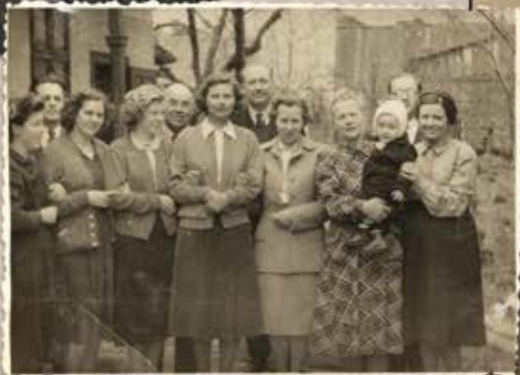
• Vendégekkel és barátokkal a Major utcai ház udvarán, 1955 III