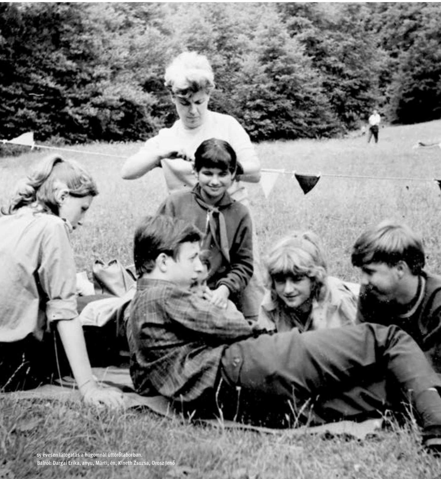
15 évesen látogatás a húgomnál úttörőfáborban.