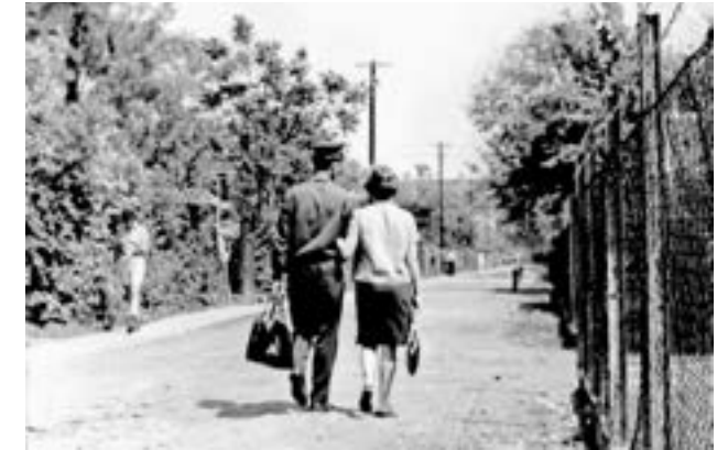
Utca részlet (1969) - Márton Sándor

Visszanézve és persze mai fejjel gondolkodva, bizonyára nem volt könnyű feladat négy gyereket itt felnevelni, hiszen ezek a házak komfort nélküliek voltak. Gépek akkor még nem segítették a munkát, hol volt még a mosógép, centrifuga, szuper mosószer! Nálunk például a hétfő volt a mosás napja. Reggeltől melegegett a víz a mosófazekakban, aztán elő a teknő, súrolókefe, mosószappan. Vízhordás a kútról, öblítés, teregetés. A vasalás sem volt egyszerű a szenes vasalóval. A telepi asszonyok közül csak egy-kettőre emlékszem, aki dolgozott, ez a fajta háztartás egy teljes embert igényelt. A mindennapi élet a konyhában zajlott, ott írtuk például a leckéinket a konyhaasztal sarkán, miközben szólt a rádió, készült a vacsora.