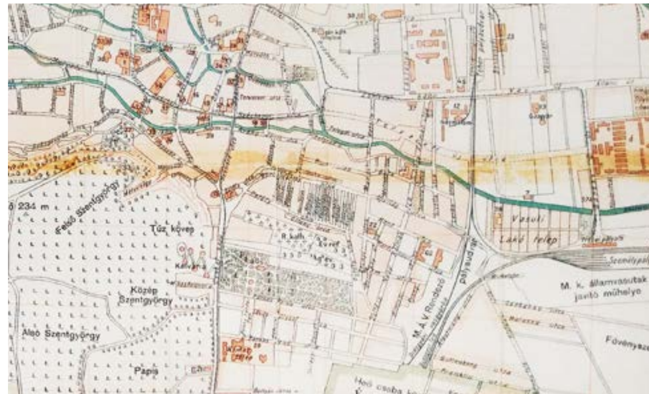
Miskolc térképe 1926-ból

Az üzletsorral szemben terpeszkedett a villanytelep, a villamos remíz. E mögött van a strand. A strand az 1920-as évektől működik, Hajós Alfréd tervezte az akkoriban nagyon modernnek és impozánsnak számító fürdőt. A meleg vizet a villanytelep hulladék hője szolgáltatta, így